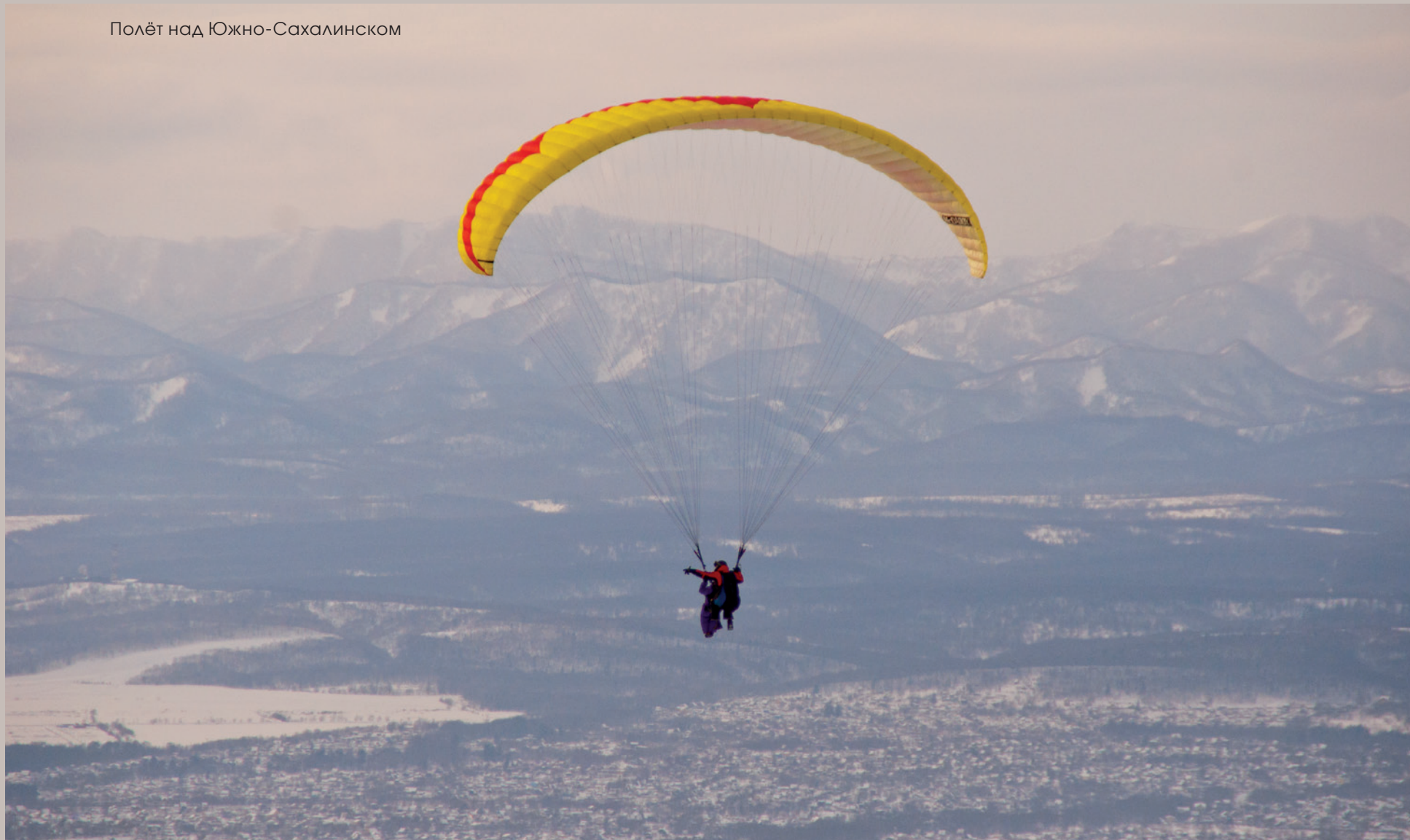
Полёт над Южно-Сахалинском