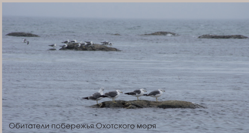
Обитатели побережья Охотского моря

как и весь остров, не узнаешь – и потому я очень хочу вернуться в Южный, да и вообще на Сахалин ещё и летом. Тем более что летом там тоже есть на что посмотреть... На побережье, где мы любовались ледовым прибоем, прилетают лебеди, в море плещутся, совсем недалеко от людей, морские коттики... Писать об этом в прозе сложно, поэтому закончить хочу строчками Алексея Баяндина: